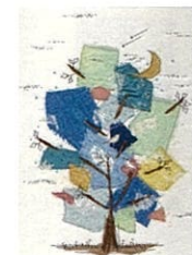
まつやまさとこ布画展